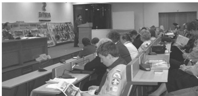
Международная научно-практическая конференция «Детское движение Русского Мира – тенденции развития», организатор – НОРС-Р. Подробнее – в «СМ» №50

Подготовил ски. АРСЕНИЙ КАРКАЧ по информации Ю. Карабатовой (ПСП НОРС-Р) и Н.Соколовой (АСП НОРС-Р) и фотографий А. Каркача, «Скаутов Москвы» (в составе НОРС-Р), дружины «Онего» (СК НОРС-Р), Е. Тягиловой (ОРЮР) и др. авторов.