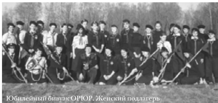
Юбилейный бивуак ОРЮР. Женский подлагерь

Фотоальбомы события: http://www.scouts.ru/modules/myalbum/viewcat.php?num=20&cid=307