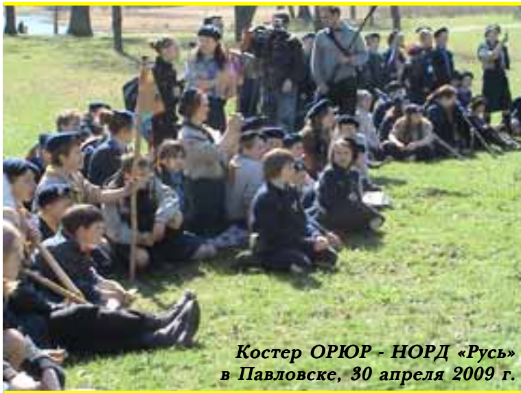
Костер ОРЮР - НОРД «Русь» в Павловске, 30 апреля 2009 г.